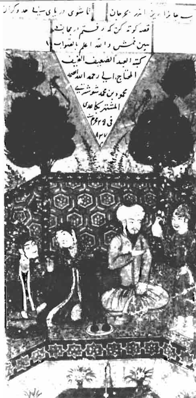
محفظة في المتحف الوطني، دلهي

الصفحة الأخيرة من المتنوي الذي كُتب في الهند سنة ٨٣٧ هـ / ١٤٣٣ م