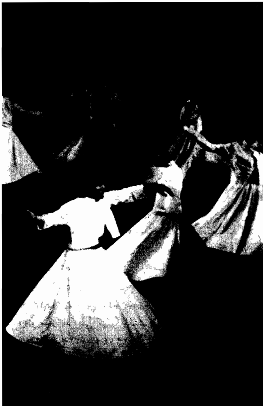
رقص المولوية (التراويش الدّوّارون)