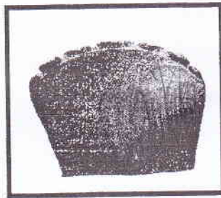
Inskripsi Telaga Batu

Apakah kepentingan upacara tersebut diadakan?