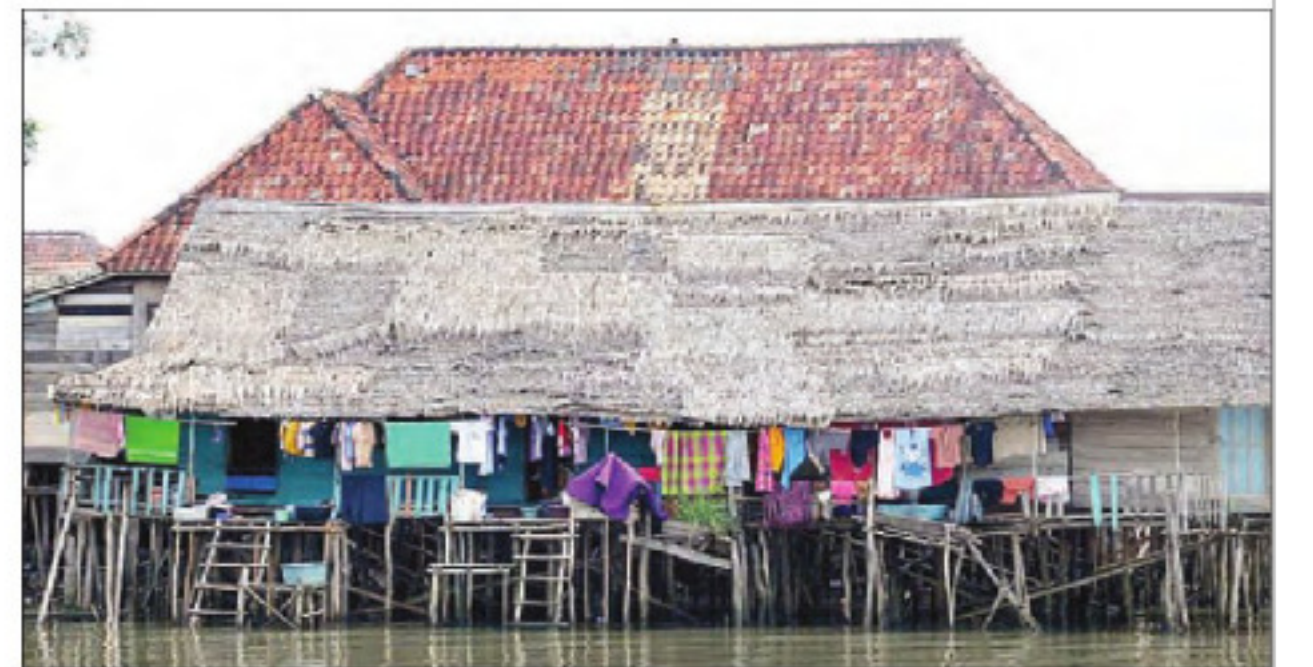
Bedah rumah tahap dua hingga saat ini belum berjalan karena kekurangan personil.