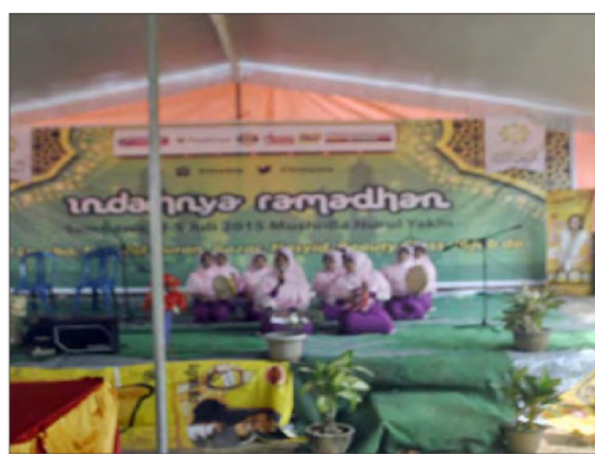
Kegiatan lomba rabbana Irmus Nurul Yakin Desa Lalang Sembawa, Minggu (14/6).

Peserta lomba yang berhasil meraih juara terbaik 1,2 dan 3, baik itu kelompok maupun perorangan mendapatkan trofi dan piagam penghargaan.