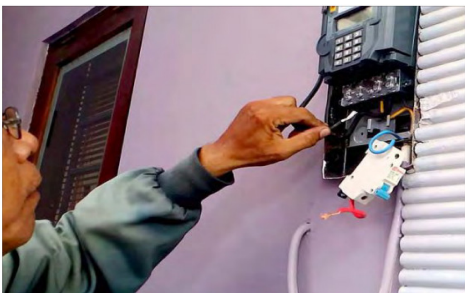
Petugas PLN saat mengecek operasional peralatan pembangkit listrik.

Jika ini terus terjadi, tidak menutup kemungkinan pengusaha akan memecat para pegawainya. "Dunia usaha mengalami kebangkrutan tambang, beban ekonomi kita berat, jadi jalan paling jelek kan cerai, marahan pisah ranjang, ya kalau gak kuat cerai (PHK)," tukas Natsir. (net)