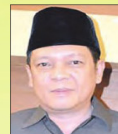
Aries HB SE

Sementara itu dalam rapat paripurna pengesahan LKPJ tersebut, dihadapan wakil rakyat itu bupati mengucapkan terima kasih atas kerja keras yang dilakukan dewan sehingga bisa merampungkan tugas konstitusi pengesahan LKPJ tersebut. Bupati juga mengatakan semua saran, masukan dan pemikiran akan menjadi