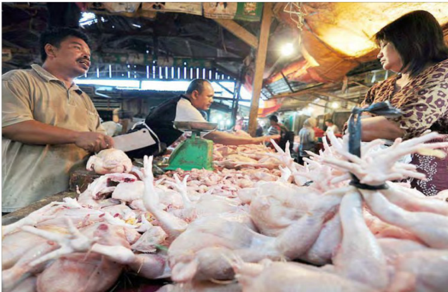
Harga ayam di pasar tradisional Kota Palembang merangkak naik jelang lebaran yang kurang dari 2 minggu lagi.

Bank sentral yakin industri perbankan akan mendorong kredit UMKM sesuai dengan target. Sebagai mana diketahui, berdasarkan data Otoritas Jasa Keuangan (OJK) total bank yang ada di Indonesia berjumlah 118 bank. (net)