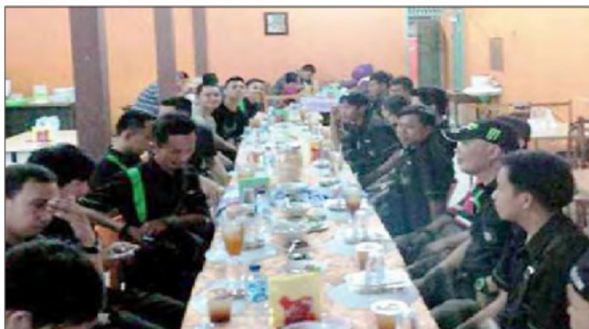
Anggota Babat Toman Ninja Club saat menggelar buka bersama.