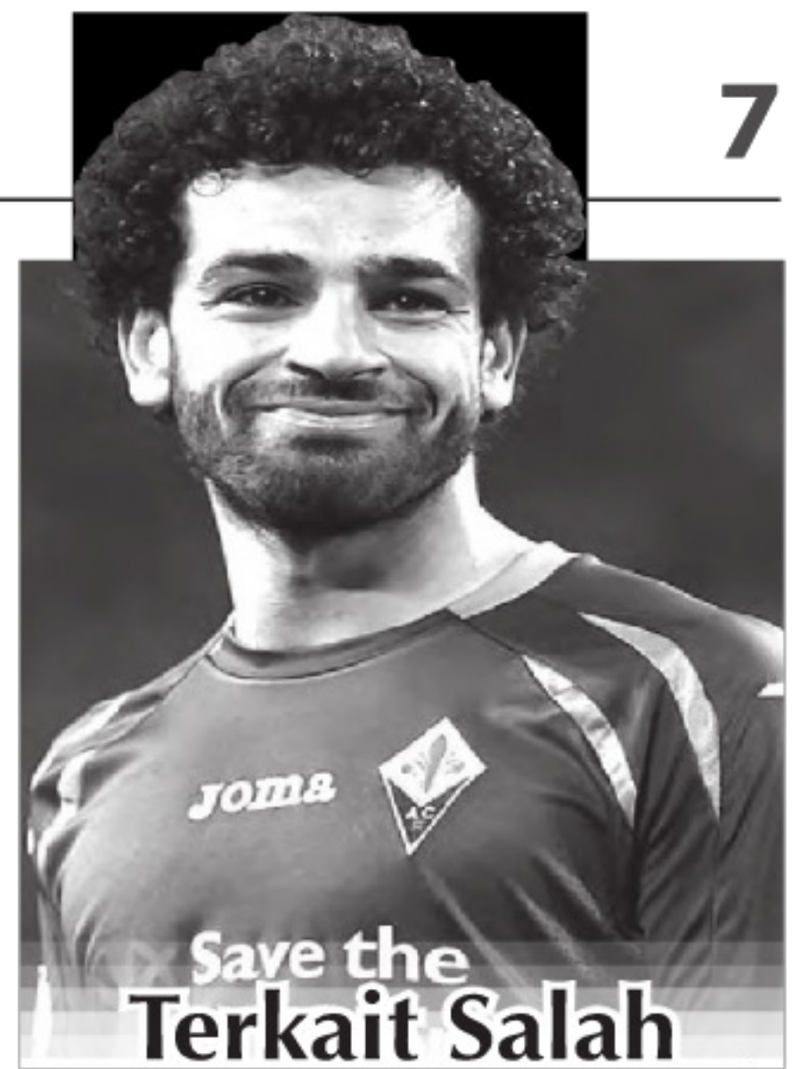
Save the Terkait Salah

Di ajang Piala Konfederasi 2005, Argentina yang lolos ke final kalah 1-4 dari Brasil. Kekalahan juga didapat Argentina di final Piala Konfederasi 1995 di tangan Denmark dengan skor 0-2. (har/dbb)