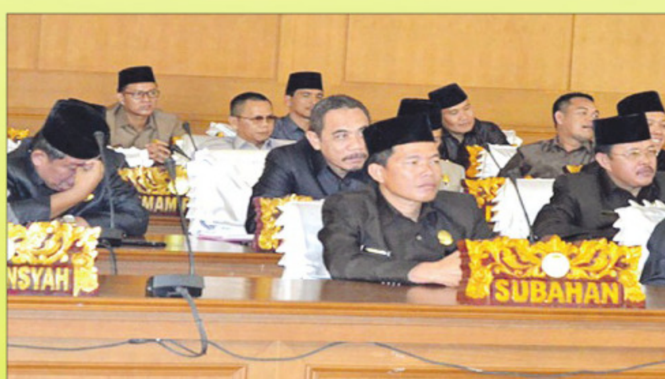
Para anggota dewan menghadiri rapat Paripurna.