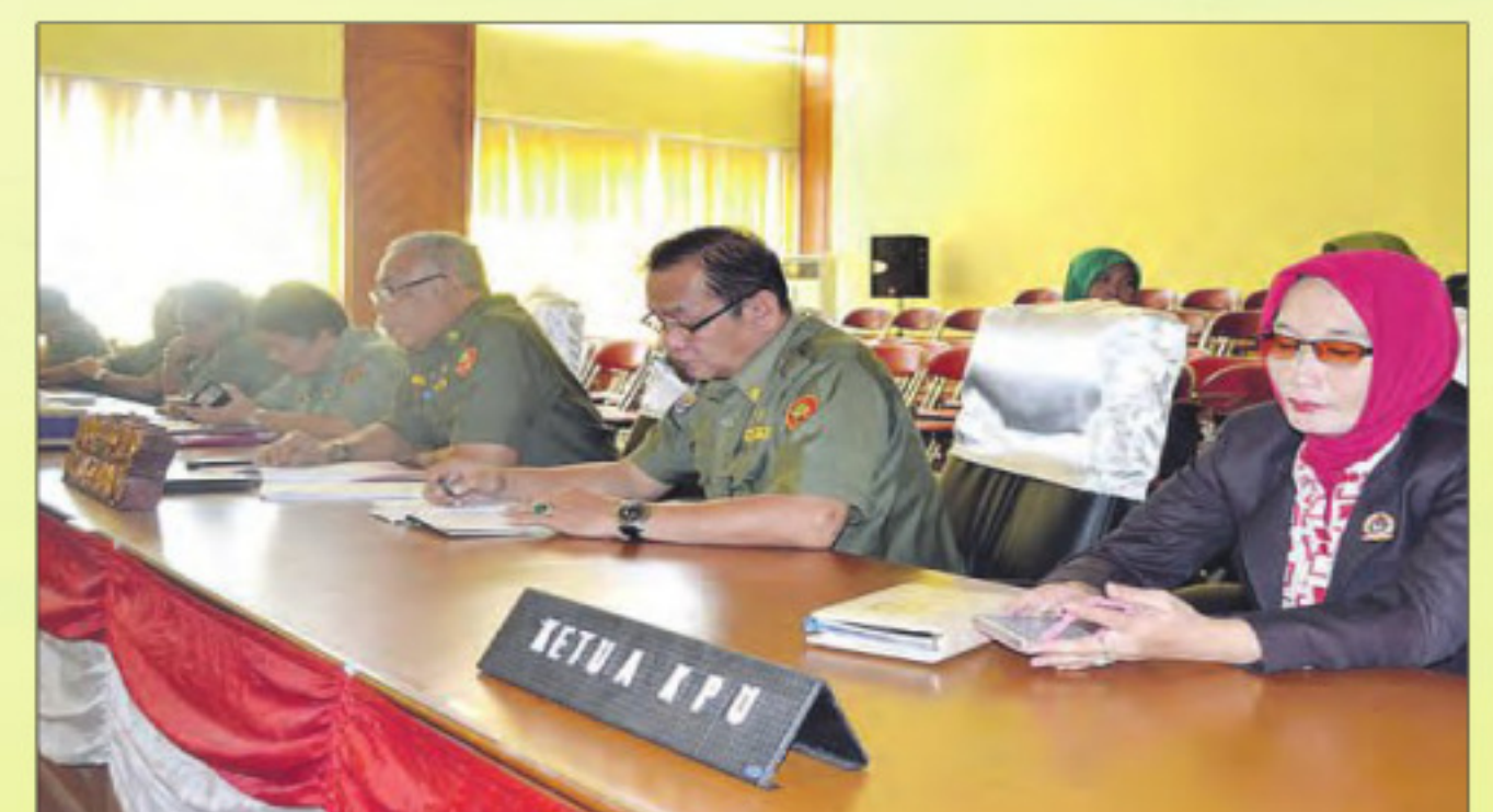
Sejumlah pejabat instansi lain hadir rapat Paripurna LKPJ dan APBDP.