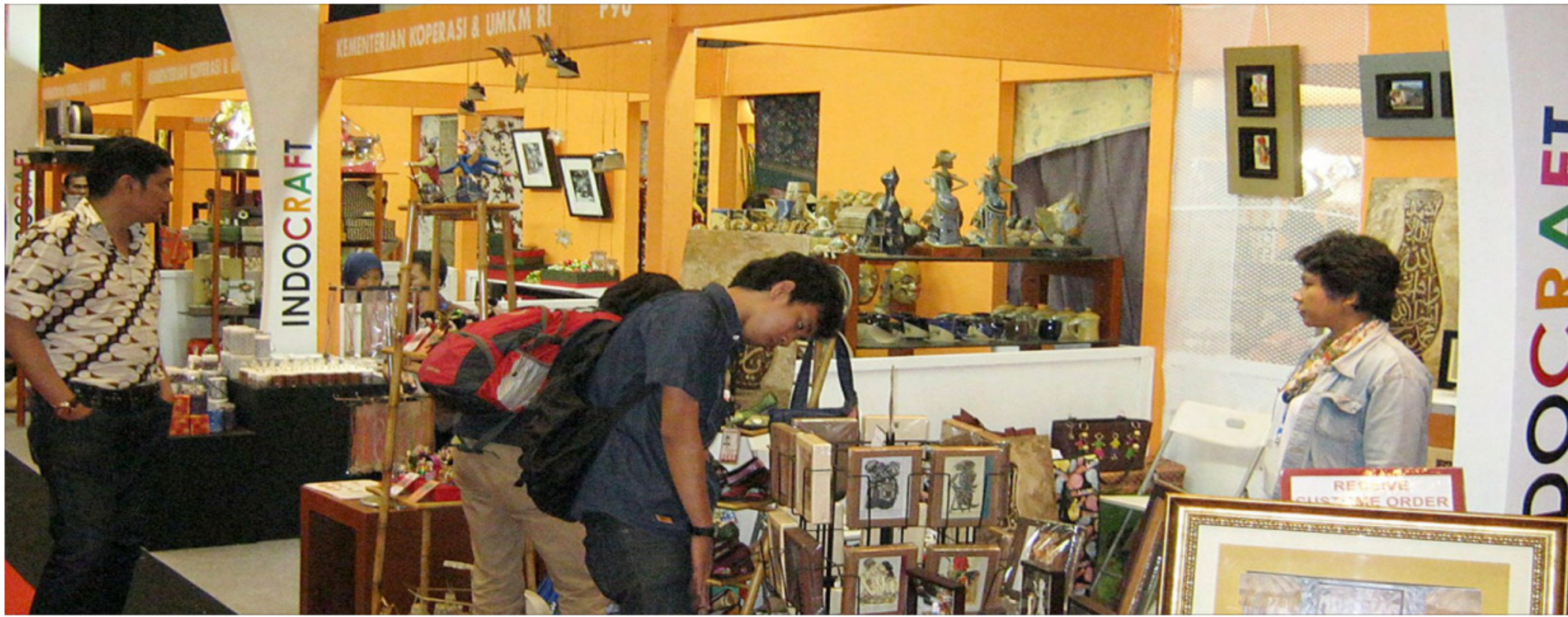
Sejumlah produk dari Usaha Mikro Kecil dan Menengah yang dipamerkan secara nasional untuk mempromosikan hasil-hasil kerajinan pengusaha kecil.

Padahal, lanjut dia, pemerintah bertujuan untuk memberikan subsidi kepada masyarakat miskin. Sehingga, pihaknya meminta pemerintah untuk lebih realistis. "Dalam pemberian subsidi listrik 2016 kita minta enggak naikan tarif 450 VA dan 900 VA. Pemberian subsidi listrik ditujukan 30 juta rumah tangga untuk miskin dan rentan miskin," kata dia. (net)