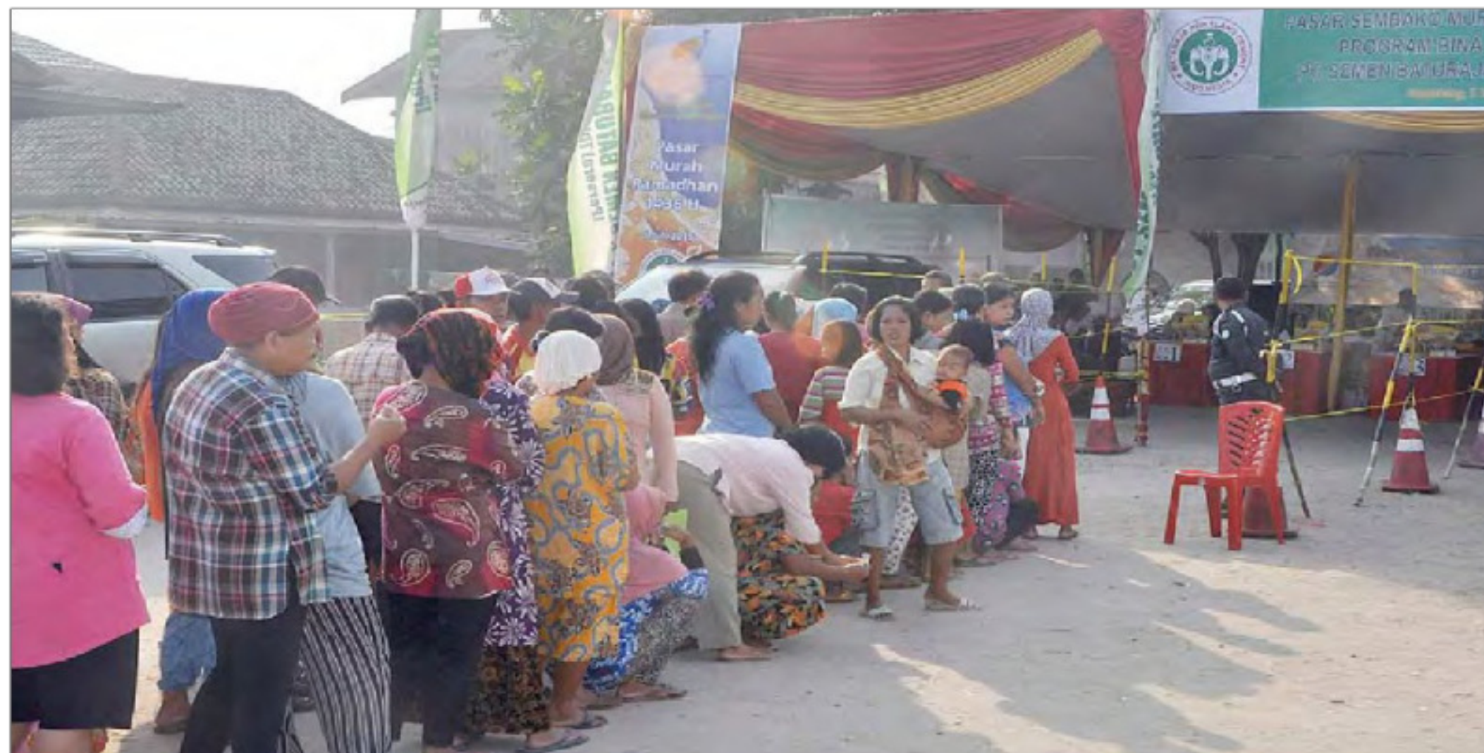
Sejumlah warga mengantri untuk membeli paket sembako murah dari PT Semen Baturaja, Minggu (5/7).

"Membaca Al Quran itu ibadah. Jadi, cintailah Al Quran dengan segenap raga kita," ajak Ustadz Solihin. (ety)