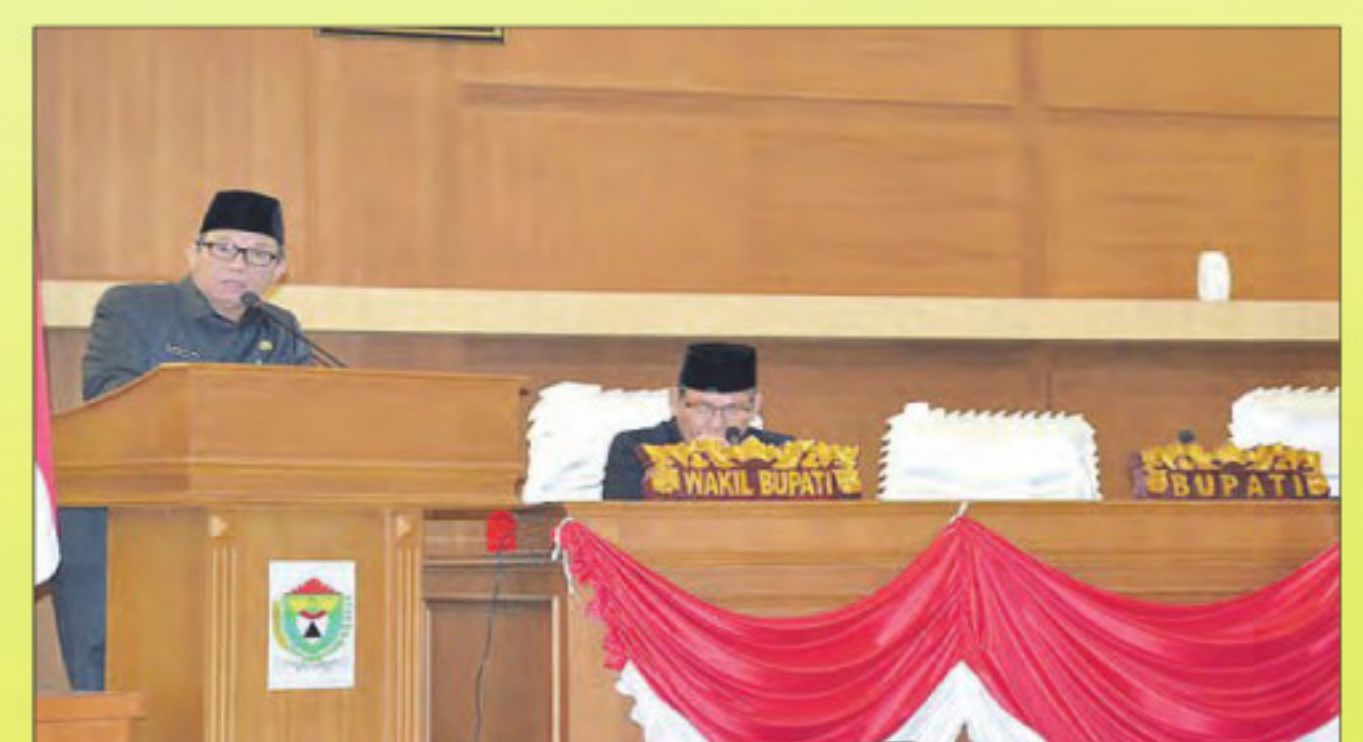
Bupati saat memberikan sambutan usai pengesahan LKPJ 2014 oleh DPRD.