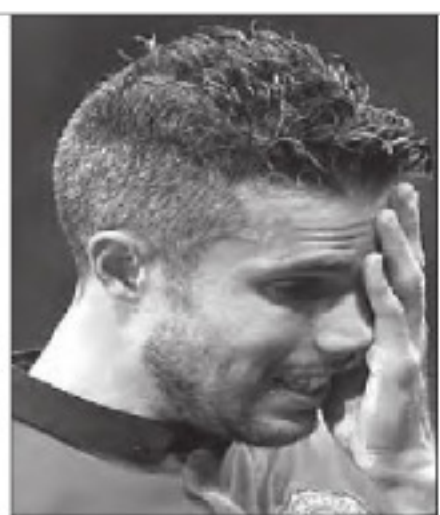
Robin van Persie