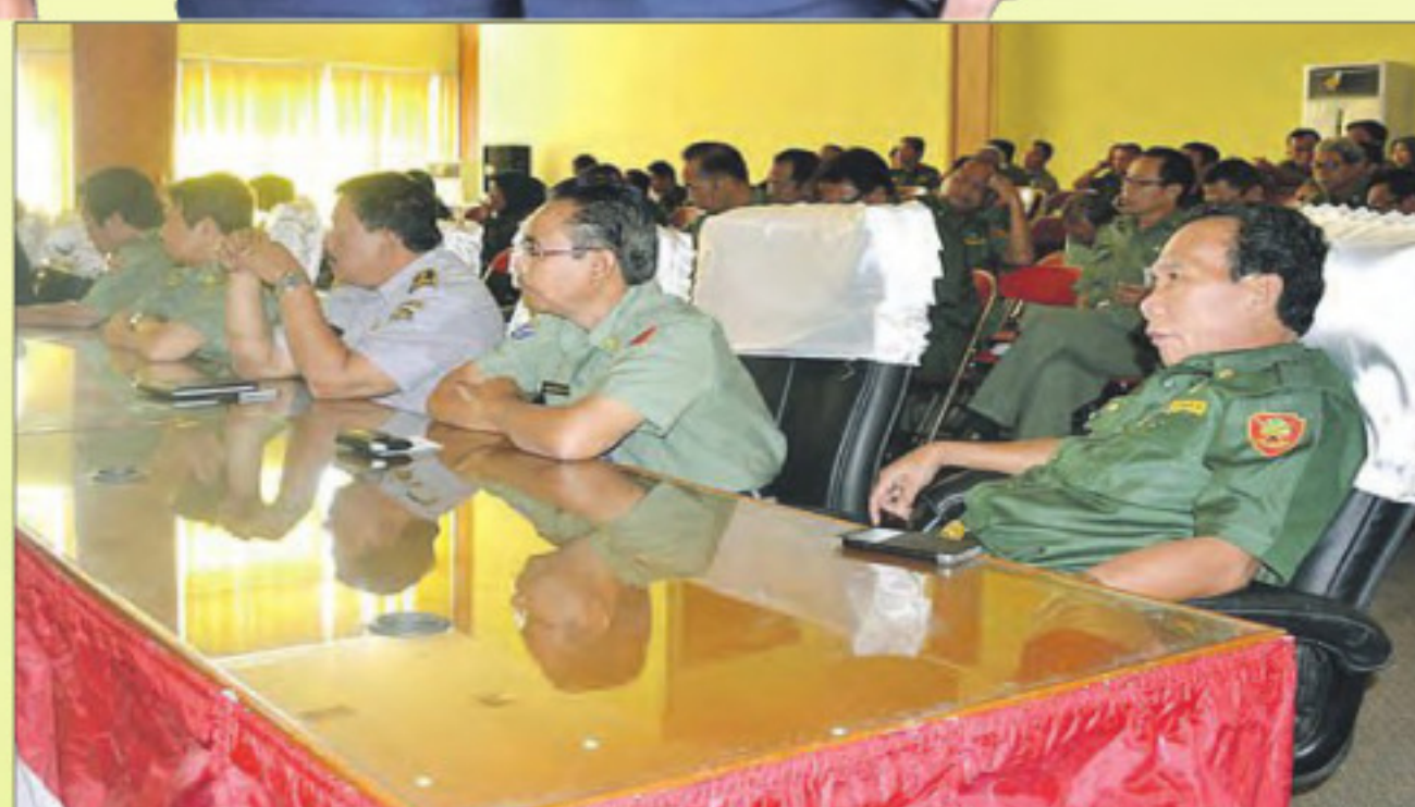
Para Asisten I, Kadin dan pejabat lainnya hadir Paripurna pengesahan LKPJ.