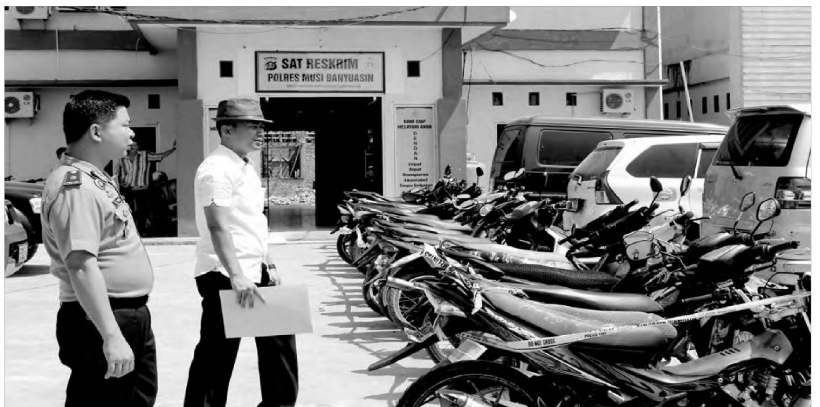
Sedikitnya, 21 motor tanpa surat-surat diamankan di Mapolres Muba, hasil penggebrekan dari rumah pelaku penadah, kemarin.

Diketahui, Badan Lingkungan Hidup (BLH) Kabupaten Banyuasin Senin (1/6) lalu, mengambil sampel air limbah, terhadap ketiga perusahaan di Desa Gasing, Tanjung Lago, Banyuasin. (far)